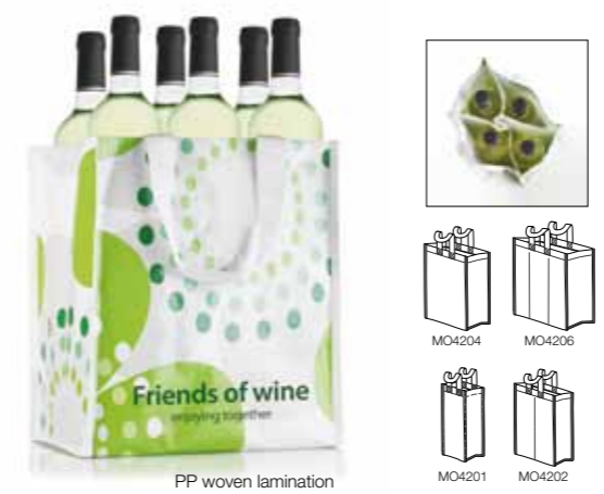
PP woven lamination